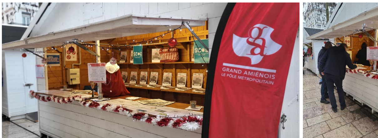
Chalet SCOT du Marché de Noël – 8 décembre 2025

La présence au marché de Noël d'Amiens, durant deux journées, a permis un contact direct avec près de 120 personnes, auxquelles le cahier spécial du Courrier Picard a été distribué. Ces échanges informels ont donné lieu à des réactions spontanées, des interrogations et des remarques illustrant la perception du projet par un public souvent éloigné des démarches de concertation institutionnelles.