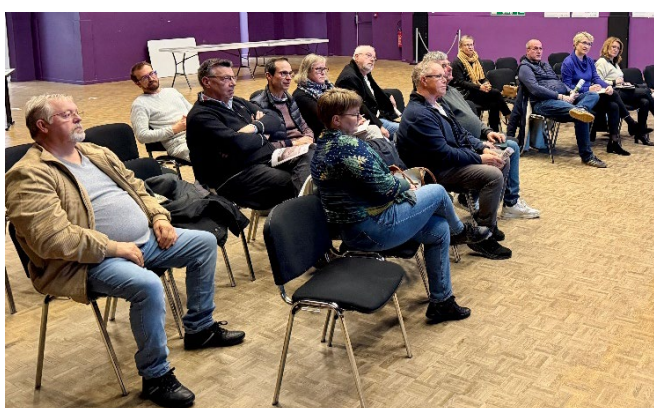
Moreuil – 9 décembre 2025

Le choix des communes d'accueil de ces réunions de concertation n'a pas été le fruit du hasard. Il répondait à la volonté de couvrir chacun des secteurs géographiques du Grand Amiénois autour desquels a été élaboré le diagnostic et a été construit le projet : Nord-Est, Sud-Ouest, Sud-Est, pôle urbain et couronne amiénoise. Cette répartition spatiale était de nature à favoriser des remontées différenciées en rapport avec les spécificités territoriales de chaque secteur.