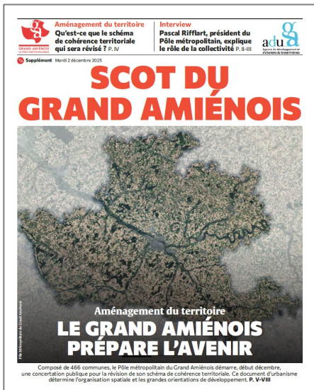
Courrier Picard – Cahier spécial SCOT