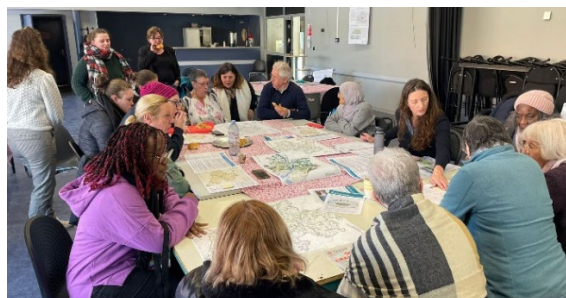
Café Bavard – L'Odysée – 6 janvier 2026