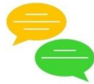
Table des illustrations

Les illustrations (photos et autres) reprises dans ce rapport ont pour but d'illustrer des situations et cas de figure liés à la problématique de la sous-alimentation d'une partie de la population étudiante du secteur d'Amiens.