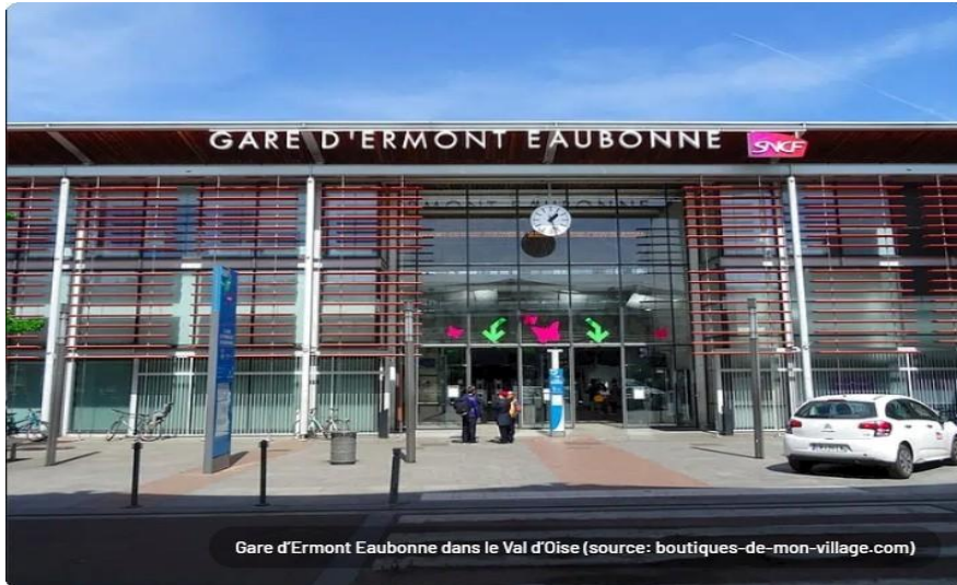
Gare d'Ermont Eaubonne dans le Val d'Oise

Ces tubes se vendent aussi dans des stations—services car ils correspondent aux dimensions des poses gobelets dans nos voitures, ils sont aussi pensé pour convenir à la respiration des fruits et légumes en permettant une bonne conservation de ces derniers. ( www.fruitube.es )